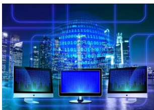
(Attēli no interneta vietnēm)