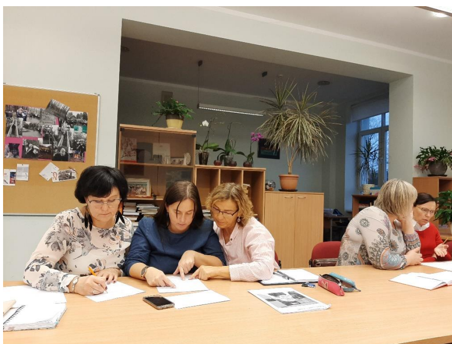
Attēlos Rīgas Kultūru vidusskolas skolotāji mācību procesa plānošanā mācību priekšmetu jomas ietvaros.