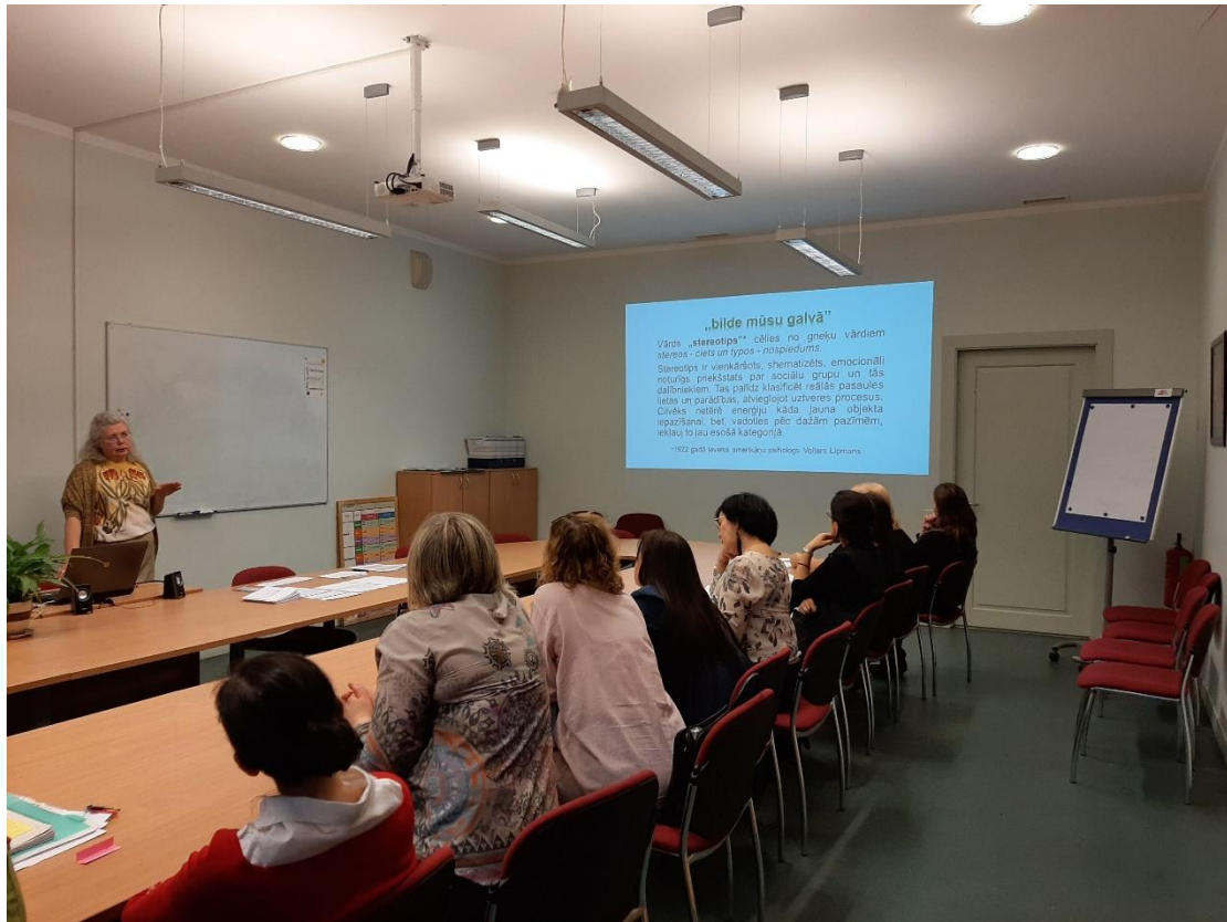
Attēlā Rīgas Kultūru vidusskolas skolotāji mācību procesa plānošanā mācību priekšmetu jomas ietvaros.