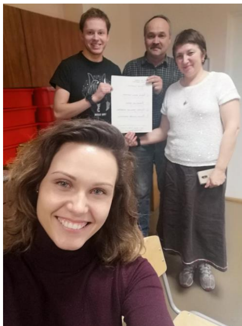
Attēlos Rīgas 34. vidusskola pedagogi